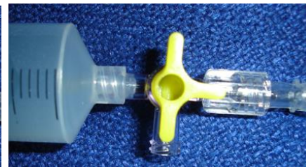
Afbeelding 3 Leeglopen ballon