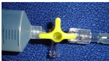
Afbeelding 2 Vullen ballon